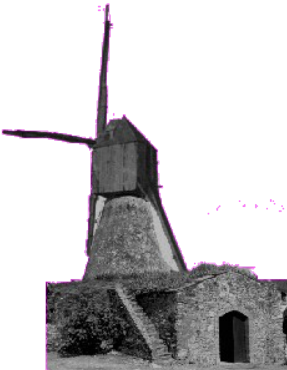
Exemple de moulin cavier

Il existe déjà en l'an mil et s'appelle Pouan ou Pouen. Une auberge y est aménagée vers 1860 car c'est un lieu très fréquenté par les promeneurs, les pêcheurs et les voituriers.