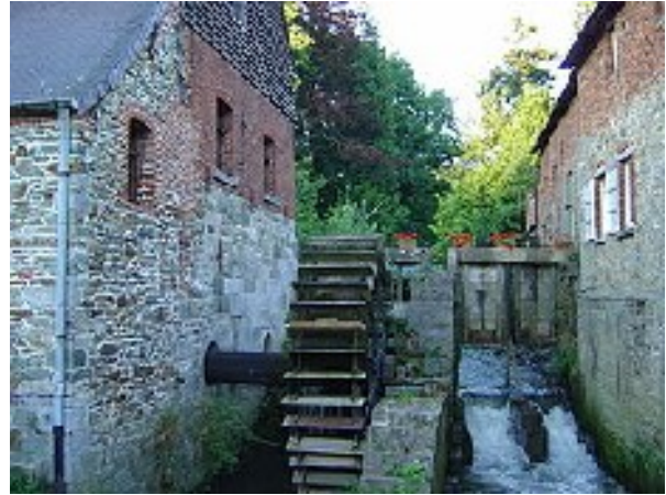
Exemple de moulin à eau

Abandonné depuis 1914, le moulin à eau est repris en 1963 par Louis Tharreau qui fait descendre le courant électrique et en fait une laverie de soies de cochon utilisées pour la fabrication de pinceaux.